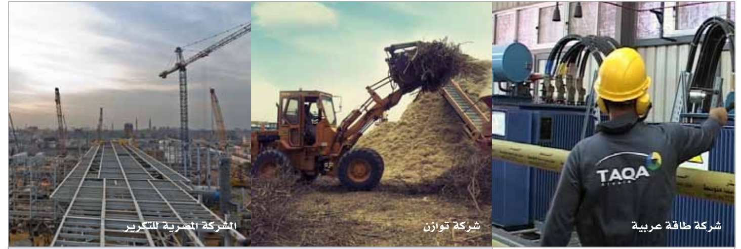
الشركة المصرية للتكرير

المخلفات الزراعية التي تم جمعها وتدويرها (إيكارو) عام ٢٠١٥