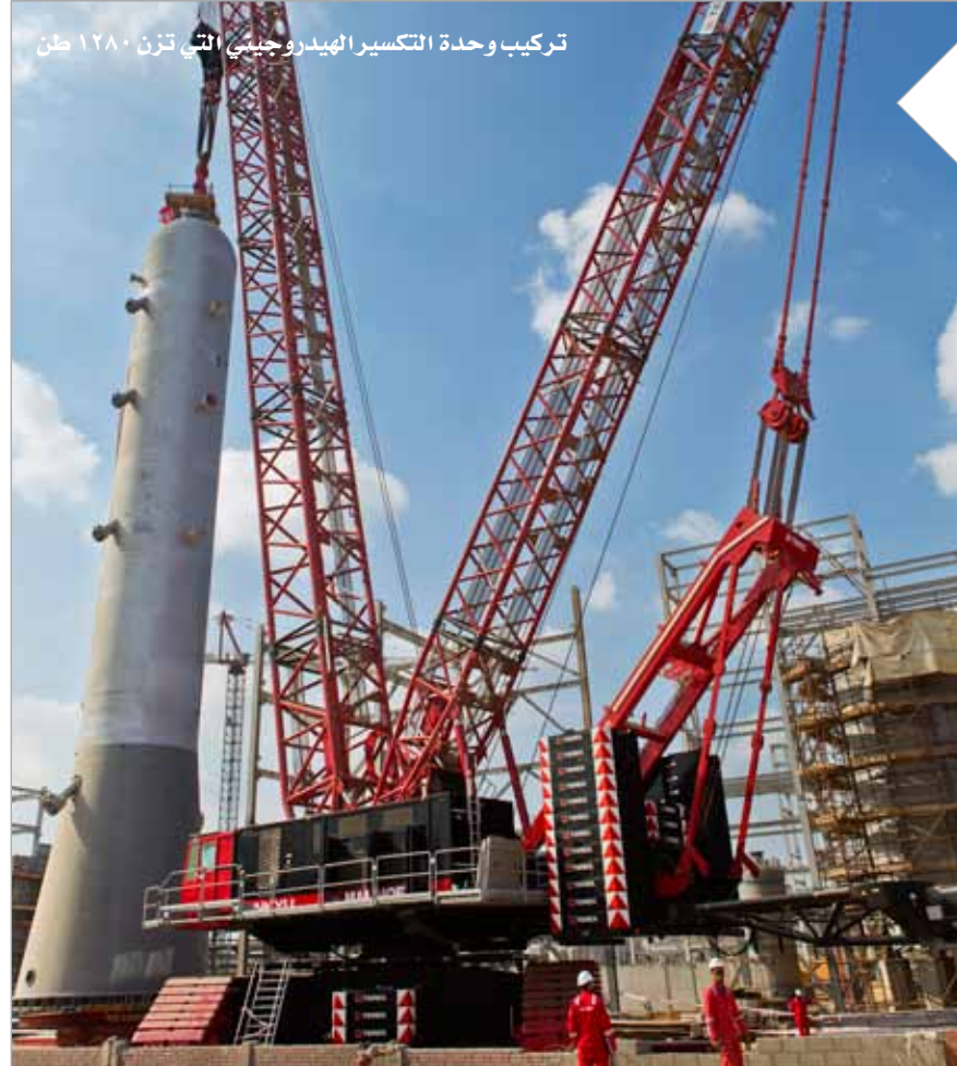
تركيب وحدة التكسير الهيدروجيني التي تزن ١٢٨٠ طن